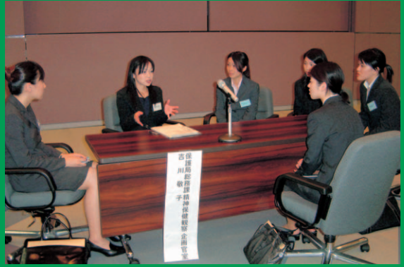
国家公務員1種試験志望者を対象とした「女性のための業務説明会」質疑応答の様相(法務省)〔本文は3ページ〕