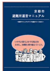
運営マニュアル（本編）