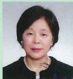
海老井 悦子氏 福岡県副知事